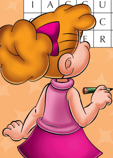
Ilustração: Rogério Chimello