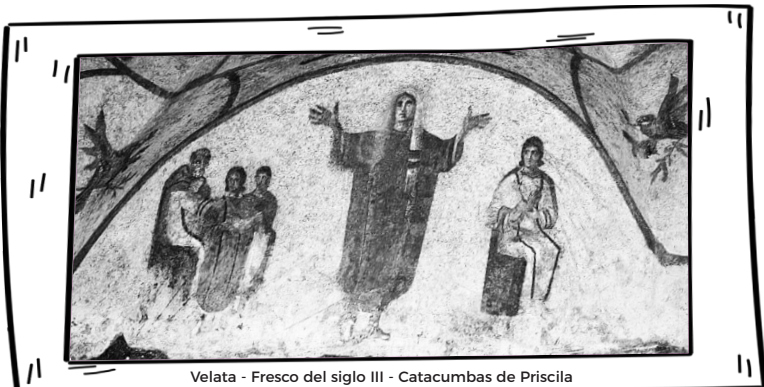
Velata - Fresco del siglo III - Catacumbas de Priscila

En las catacumbas de Priscila en Roma, hay un fresco (pintura sobre mortero húmedo) conocido como Velata, fechado aproximadamente en el año 250 d. C. En él hay tres escenas sucesivas de izquierda a derecha (relatando una historia). En la escena más a la izquierda, un hombre está sentado, una mujer joven de pie frente a él y un hombre joven a su lado sosteniendo un velo. La mujer parece ser posiblemente retratada como joven, debido a su menor tamaño con relación al hombre sentado. En la siguiente escena, en la parte central del fresco, la mujer aparece con el velo, en posición de oración, flanqueada por dos palomas, una de cada lado. En la siguiente escena, en el lado derecho del panel, la misma mujer está sentada, vestida con ropa similar a la del hombre en el lado izquierdo del panel, y sostiene a un bebé en sus brazos. Este fresco cristiano ilustra probablemente la trayectoria espiritual de esta mujer: al principio, es instruida y recibe el velo. Luego, es bautizada por el Espíritu Santo, representado por las palomas. Finalmente, se convierte en maestra,