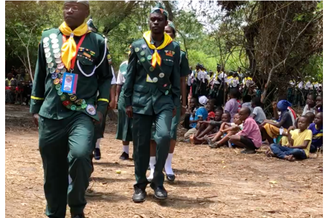
Los jóvenes de la Asociación del Sureste de Tanzania (ECD) pasaron del 12 al 22 de diciembre de 2018 en la selva de Ruvu, Mlandizi Pwani, en Tanzania, estudiando lecciones de mayordomía bajo el tema: «Dios primero», traducido en swahili como «Mungu Kwanza» basado en Mateo 6: 33.