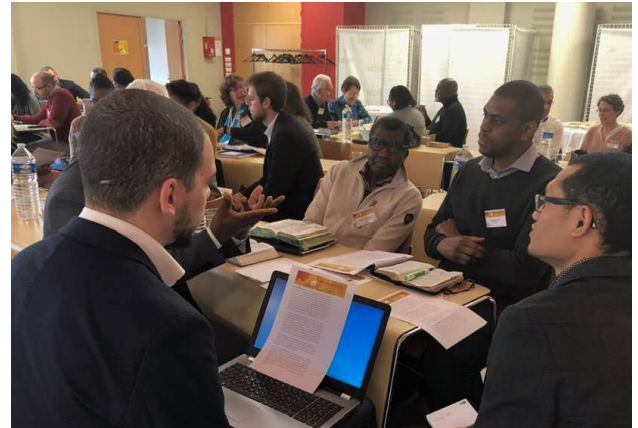
Convención de mayordomía para los territorios de habla francesa, del 7 al 11 de febrero de 2019.