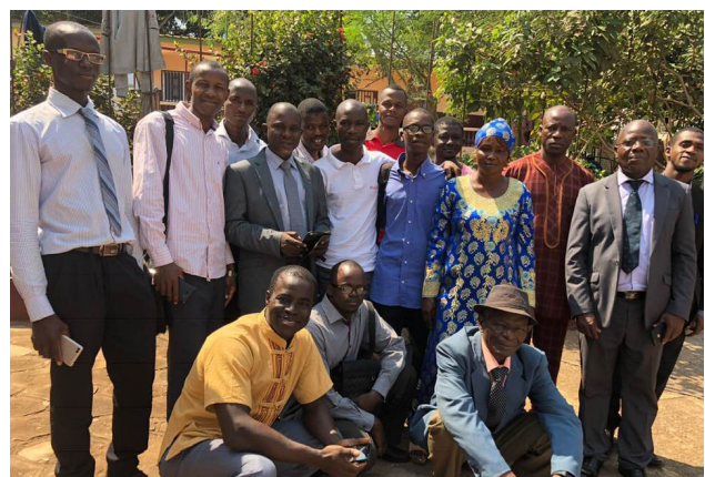
Convención de pastores de mayordomía en Conakry, Guinea.