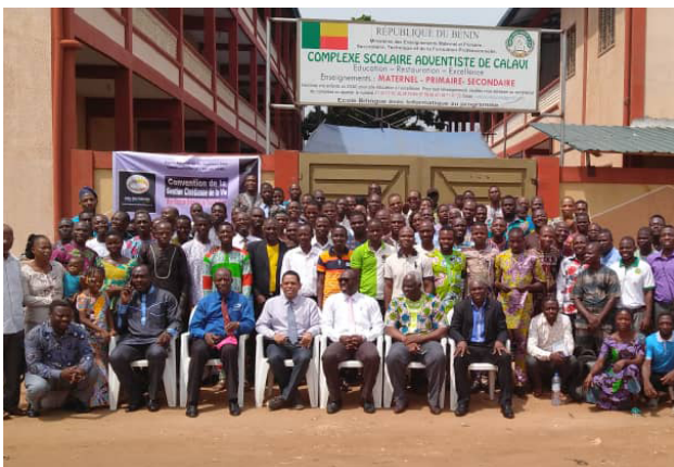
Entrenamiento de Mayordomía en Ouagadougou, Burkina Faso, del 21 al 27 de febrero de 2019.