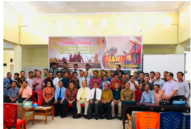
Seminario «Dios Primero» en la ciudad de Kalay de la Misión del Alto Myanmar/Unión Misión Myanmar (izquierda) y la Misión de Kalimantan del Este de WIUM (Unión Misión de Indonesia Occidental) (derecha).