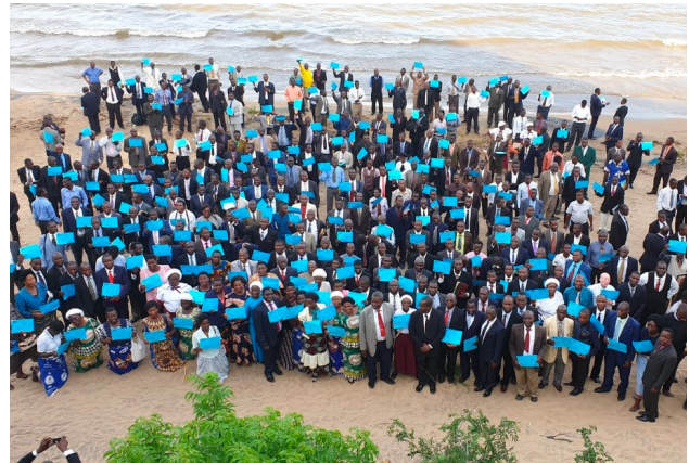
La capacitación de entrenadores de «Dios Primero» en la Asociación de la Unión de Malawi contó con la presencia de dirigentes de la Unión y de las Asociaciones, pastores de todas las Asociaciones, tesoreros y dirigentes de mayordomía. La imagen de la derecha muestra algunos delegados posando con certificados.