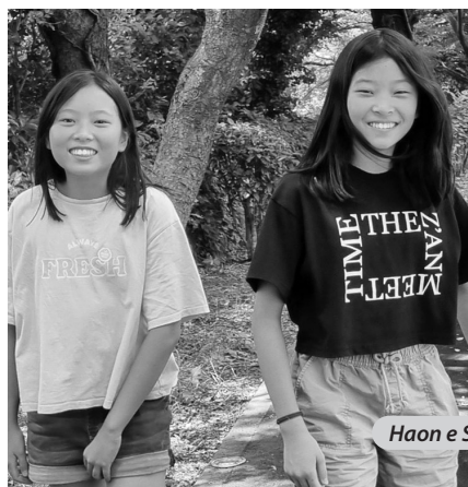
Haon e Sion